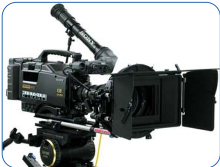
Caméra SONY HDW F900

Quand la vidéo HD s'affirme comme le futur standard mondial, MAUNOIR IMAGES choisit de s'allier à l'un des rares experts de la norme HD Cinealta.